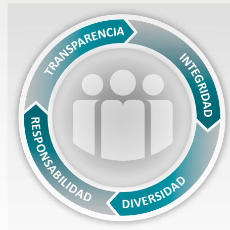
VALORES DEL GRUPO

Hace referencia a la debida identificación, valoración y asunción de las consecuencias de los actos del Grupo teniendo presentes las obligaciones contraídas y las expectativas de los grupos de interés.